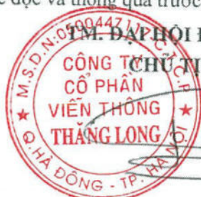
Phạm Tiến Dũng

Tất cả các nội dung tại Đại hội đồng cổ đông phải được Thư ký Đại hội ghi vào Biên bản họp. Nghị quyết họp Đại hội đồng cổ đông phải được đọc và thông qua trước khi bế mạc Đại hội.